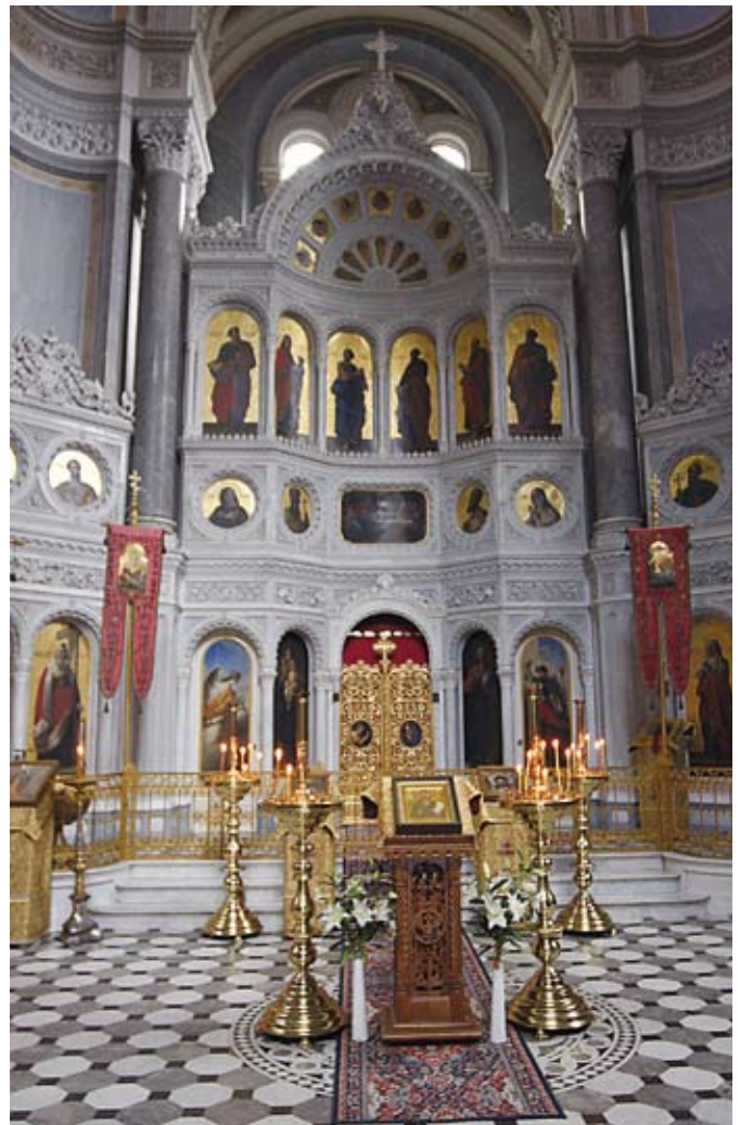
Mit dem Eintritt in die Kapelle betritt der Besucher auch eine andere Welt. Orthodoxe Liturgien klingen aus Lautsprechern, Ikonen und vergoldete Kerzenständer schimmern überall.

Elisabeth bemühte sich nach Kräften, ihrem Volk eine gute Herrin zu sein, engagierte sich sozial, gab den Anstoß zur Gründung der ersten Poliklinik. Glücklicherweise wurde sie in Wiesbaden jedoch nicht. Zeitgenossen attestierten ihr schon früh eine gewisse Traurigkeit, ein Phlegma. Sie wirkte gedrückt, was zunächst nur aufs Heimweh nach Petersburg