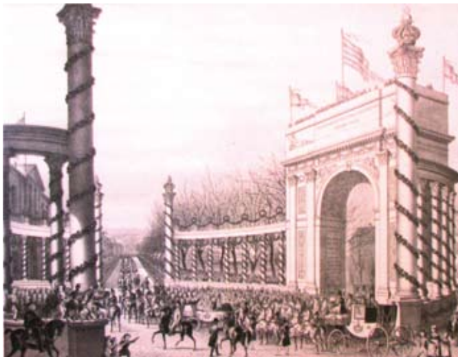
Mit großem Bahnhof empfangen die Bürger Wiesbadens ihr junges Herrscherpaar im Frühjahr 1844. Der Geisenheimer Architekt Philipp Hofmann hatten nicht nur das Vergnügen, die Ehrenpforte für den Empfang zu bauen, sondern auch die traurige Pflicht, die Grabeskapelle für Elisabeth zu errichten.

neues Zuhause, nach Wiesbaden – wo ihre Untertanen schon darauf warteten, die Landesherrin begrüßen zu dürfen. Die, vor allem die politisch Interessierten, standen einer Verbindung mit dem russischen Zarenhof zwar zunächst sehr skeptisch gegenüber. Je näher die Hochzeit rückte, desto versöhnlicher wurden die Stimmen.