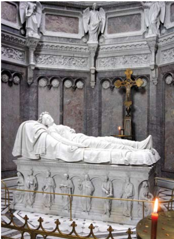
Aus weißem Marmor geschaffen ist der Sarkophag, in dem Elisabeth Michailowna ihre letzte Ruhe gefunden hat.

die kleine Tochter, der sie das Leben schenkte, überlebte die Mutter nur um einen Tag.